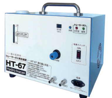
大型水素式探索ガス造成機 HT-67