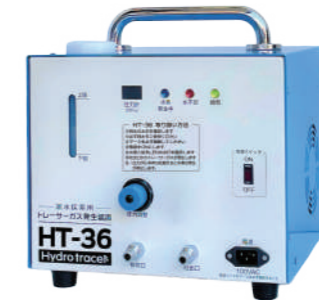
中型水素式探索ガス造成機 HT-36