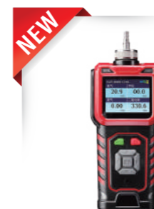
水素式漏水探索機 ココダ2