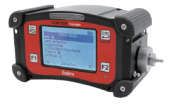
水素式漏水探索機 ハンターTG