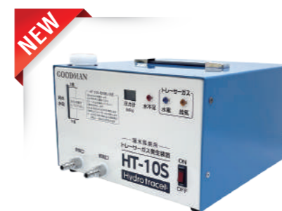
小型水素式探索ガス造成機 HT-10S